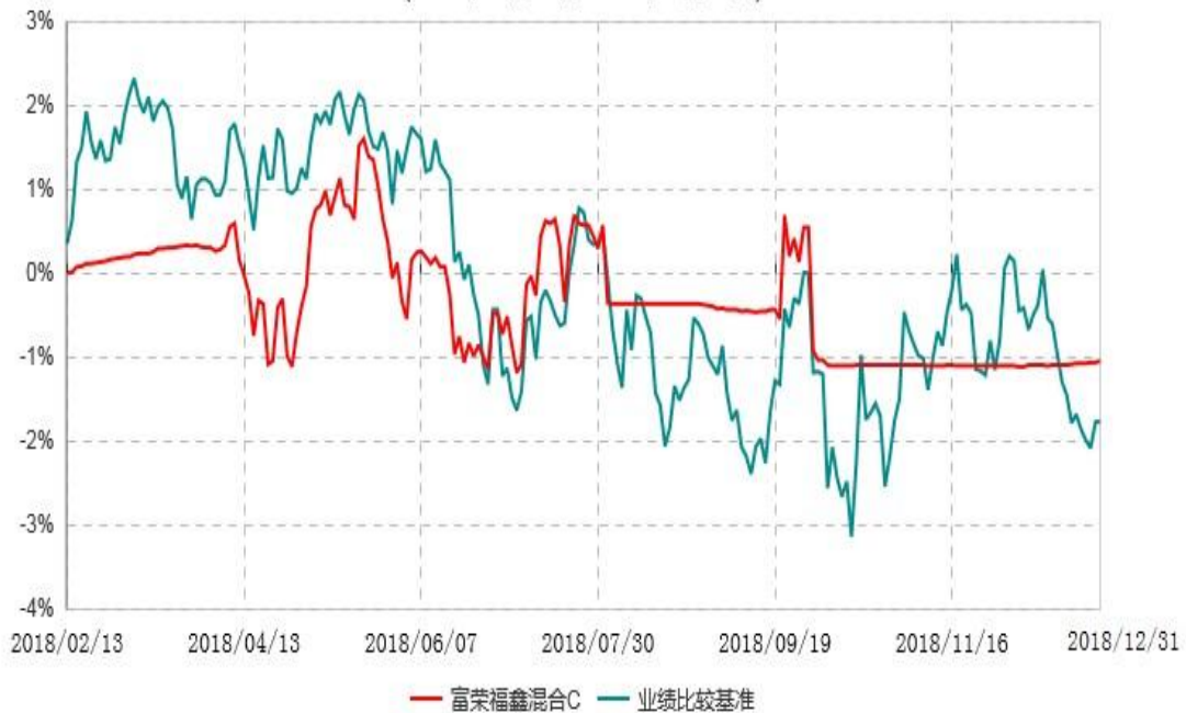
富荣福鑫混合C累计净值增长率与业绩比较基准收益率历史走势对比图 (2018年02月13日-2018年12月31日)