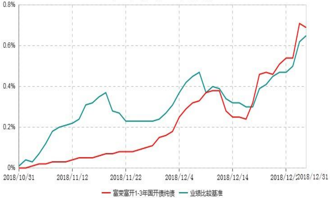
富荣富开1-3年国开债纯债债券型证券投资基金累计净值增长率与业绩比较基准收益率历史走势对比图 (2018年10月31日-2018年12月31日)

注：①本基金基金合同于2018年10月31日生效，截止2018年12月31日止，本基金成立未 满一年；