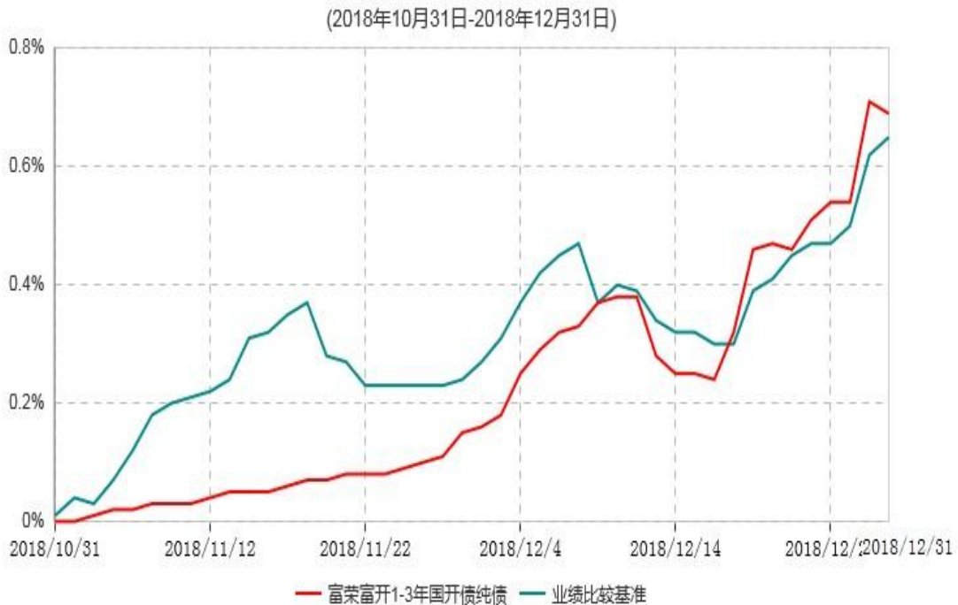
富荣富开1-3年国开债纯债债券型证券投资基金累计净值增长率与业绩比较基准收益率历史走势对比图

注：①本基金基金合同于2018年10月31日生效，截止2018年12月31日止，本基金成立未满一年；