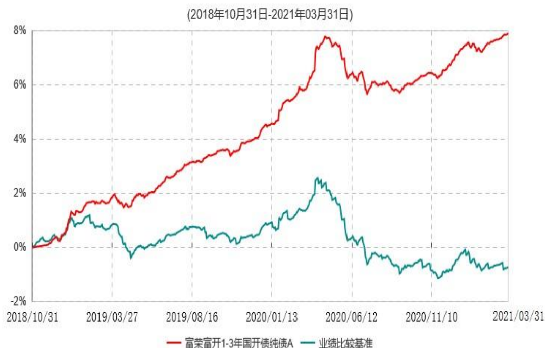
富荣富开1-3年国开债纯债A累计净值增长率与业绩比较基准收益率历史走势对比图