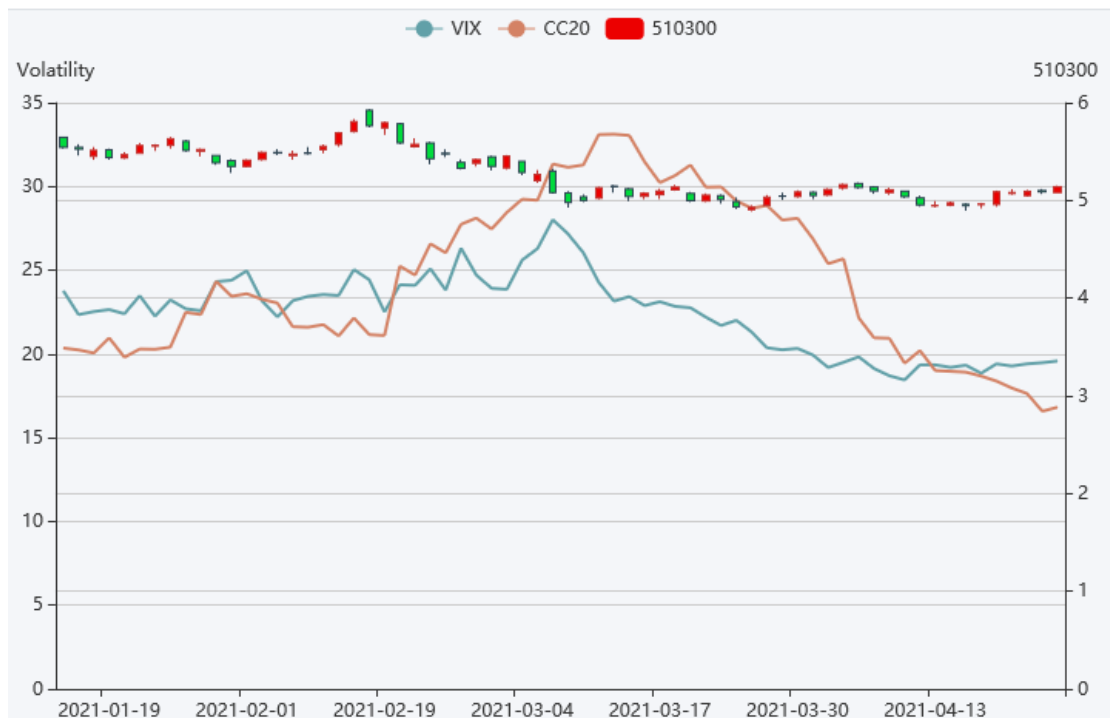
图 3 波动率指数

从市场波动率来看，上周市场反弹下波动率小幅度拉升，4 月合约到期，临近假期，市场出现一定日期效应，波动率小幅拉升属于正常现象。目前市场隐含波动率指数依然持续维持在历史 30% 分位左右，如果假期没有超越预期事件发生，那么节后波动率可能会进一步下行。