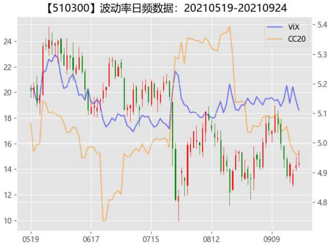
图 2：期权市场隐含波动率

沪股通流出 28.51 亿，深股通流入 12.73 亿。上周市场受中秋节外盘巨大风险影响有限，同时美联储等态度相对鸽派，A 股市场上周三低开后随即反弹，沪深 300、上证 50 隐含波动率在小幅度拉升后也快速回落，市场短期风险暂缓，但随着马上到来的国庆长假期，卖出波动率的投资者需要警惕假期波动率效应，留有余地。