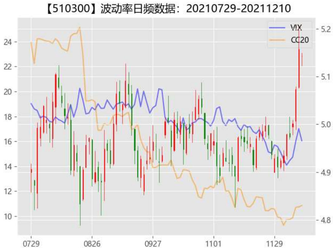
图 2 期权市场隐含波动率

从资金流动来看，北向资金本周净流入额度较大，全周合计流入 488.34 亿，其中沪股通流入 300.67 亿，深股通流入 187.67 亿。前一段时间现货市场维持窄幅震荡下，沪深 300、上证 50 隐含波动率继续大幅度回落维持在历史新低。随着南非出现的新冠变异病毒对疫情的影响有限，以及管理层对 2022 年宏观政策偏松的定调预期，市场明确提升了交投情绪，周四沪深 300 和上证 50 隐含波动率一度上涨了 5%。