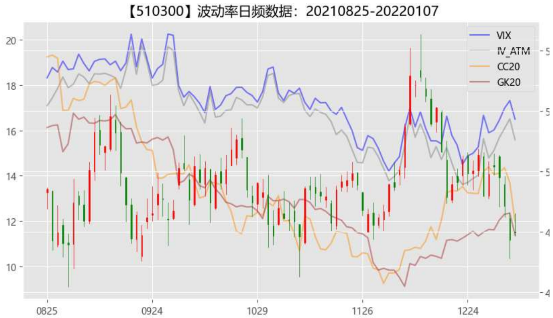
图 2 期权市场隐含波动率

从资金流动来看，北向资金上周为净流入，全周合计流入 62.03 亿，其中沪股通流入 68.53 亿，深股通流出 6.50 亿。股票市场快速回撤，虽然沪深 300、上证 50 跌幅较小，但是市场情绪受到一定侵扰，隐含波动率在新年伊始的下跌行情中出现小幅度拉升。2022 年的观点从研究分化到市场实际分化开始，一年之际在于春，投资者在期待跨年行情的时候请注意风险。