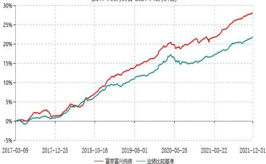
富荣富兴纯债债券型证券投资基金累计净值增长率与业绩比较基准收益率历史走势对比图 (2017年03月09日-2021年12月31日)