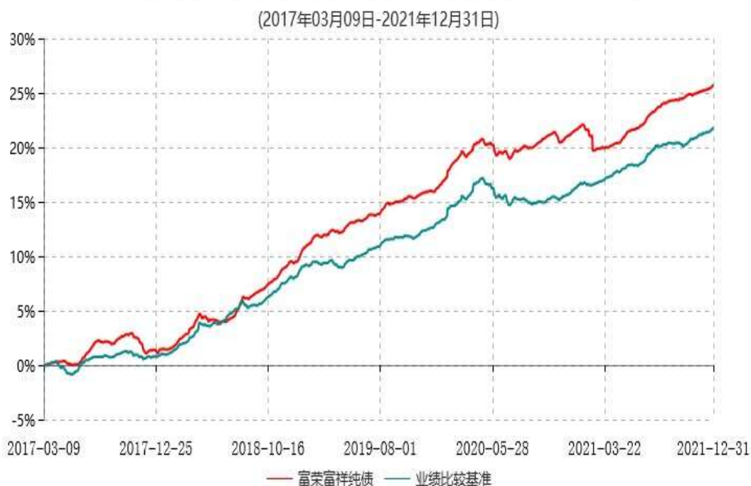
富荣富祥纯债债券型证券投资基金累计净值增长率与业绩比较基准收益率历史走势对比图