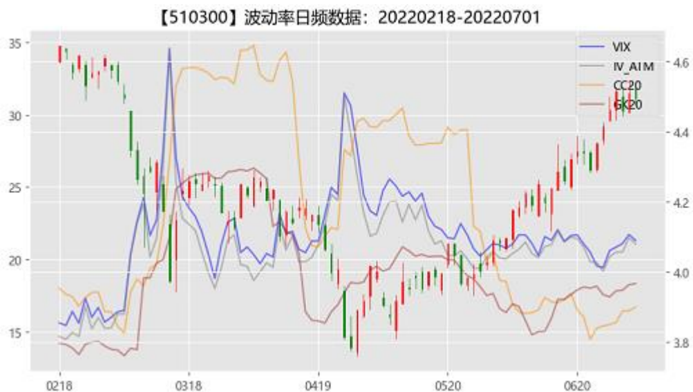
图 2：期权市场隐含波动率