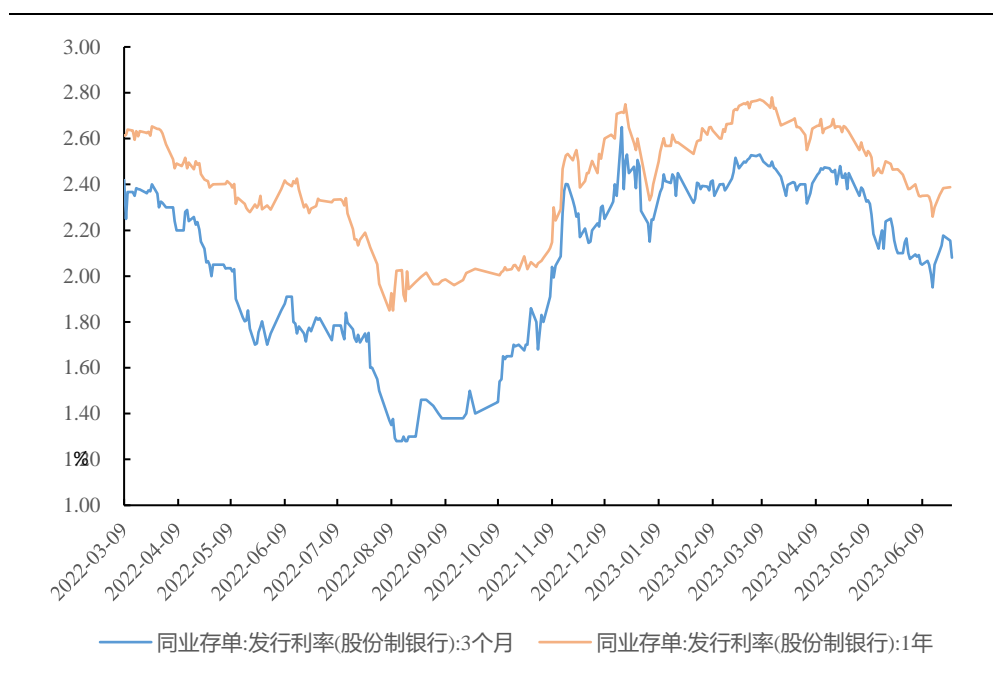
图 1、CD 发行利率上行

6月19日-6月21日银行同业存单发行规模较前一周增加402亿元至5817亿元，偿还3609亿元，当周存单净融资2208亿元。一级存单发行利率方面，3M、6M、9M、1Y期存单发行利率分别较6月16日上行12.8bp、13.3bp、7.8bp、8.4bp至2.18%、2.20%、2.33%、2.38%。二级市场收益率方面，1月期同业存单收益率上升10.01bp至2.19%，3月期同业存单收益率上升5.94bp至2.15%，6月期同业存单收益率上升2.80bp至2.19%，9月期同业存单收益率上升2.84bp至2.31%，1年期同业存单收益率上升1.50bp至2.35%。