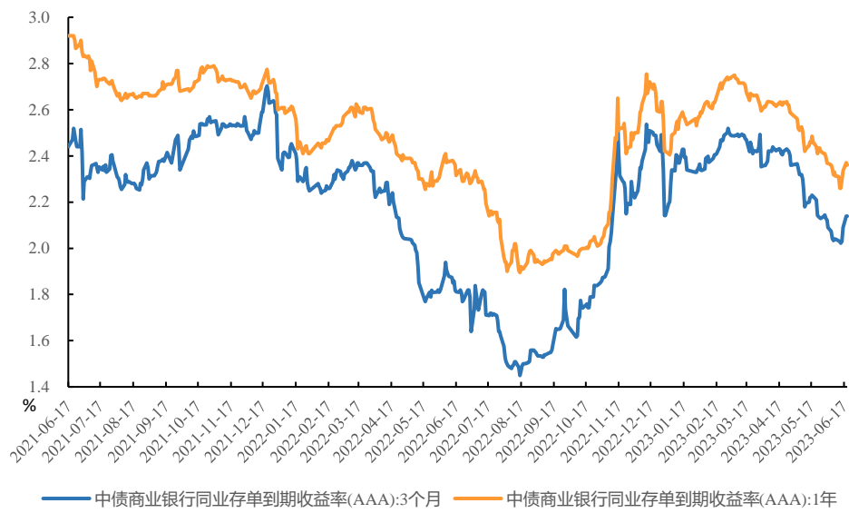
图 2、CD 收益率上行