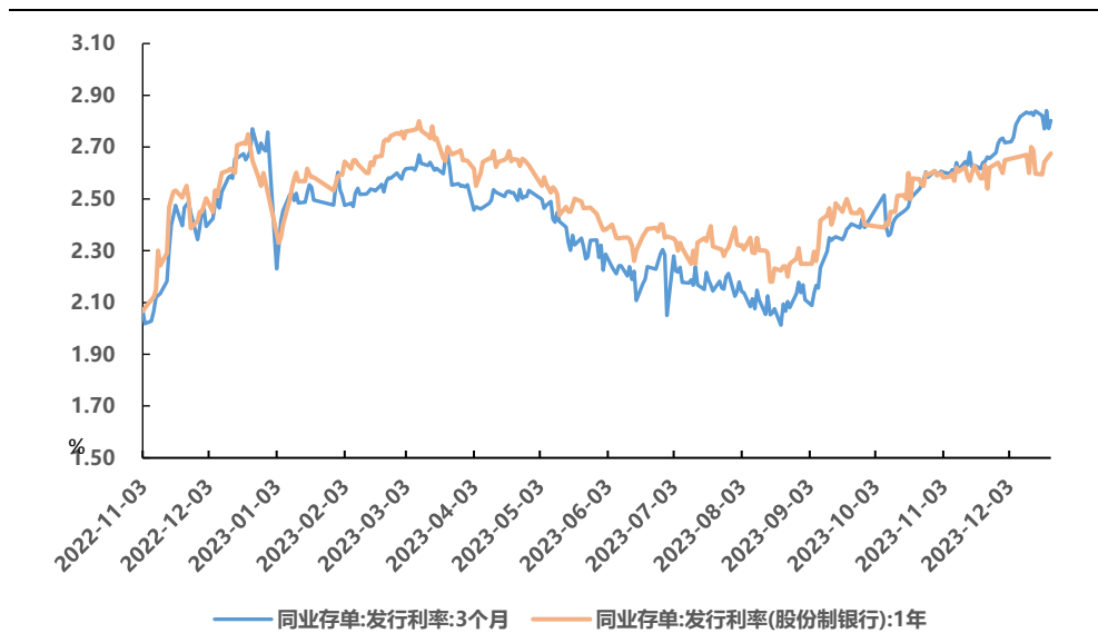
图 1、存单一级发行利率

同业存单发行规模下降，净融资额下降。上周同业存单总计发行 5987.7 亿元，净融资 713.1 亿元。本周同业存单到期量 5475.0 亿元。发行利率方面，短期限存单发行利率均有所下行，1 个月期同业存单发行利率下行 2bp 至 2.83%，3 个月期下行 2bp 至 2.80%，6 个月期下行 4bp 至 2.69，而 9 个月期上行 20bp 至 2.78%，1 年期存单利率上行 8bp 至 2.68%。二级市场方面，1 月期同业存单收益率上行 10.00bp 至 2.79%，3 月期同业存单收益率上行 0.51bp 至 2.68%，6 月期同业存单收益率上行 0.54bp 至 2.65%，9 月期同业存单收益率上行 4.53bp 至 2.65%，1 年期同业存单收益率上行 2.50bp 至 2.63%。1 年期 AAA 同业存单收益率与 1 年 MLF 利率的利差上行至-12.50bp 左右。