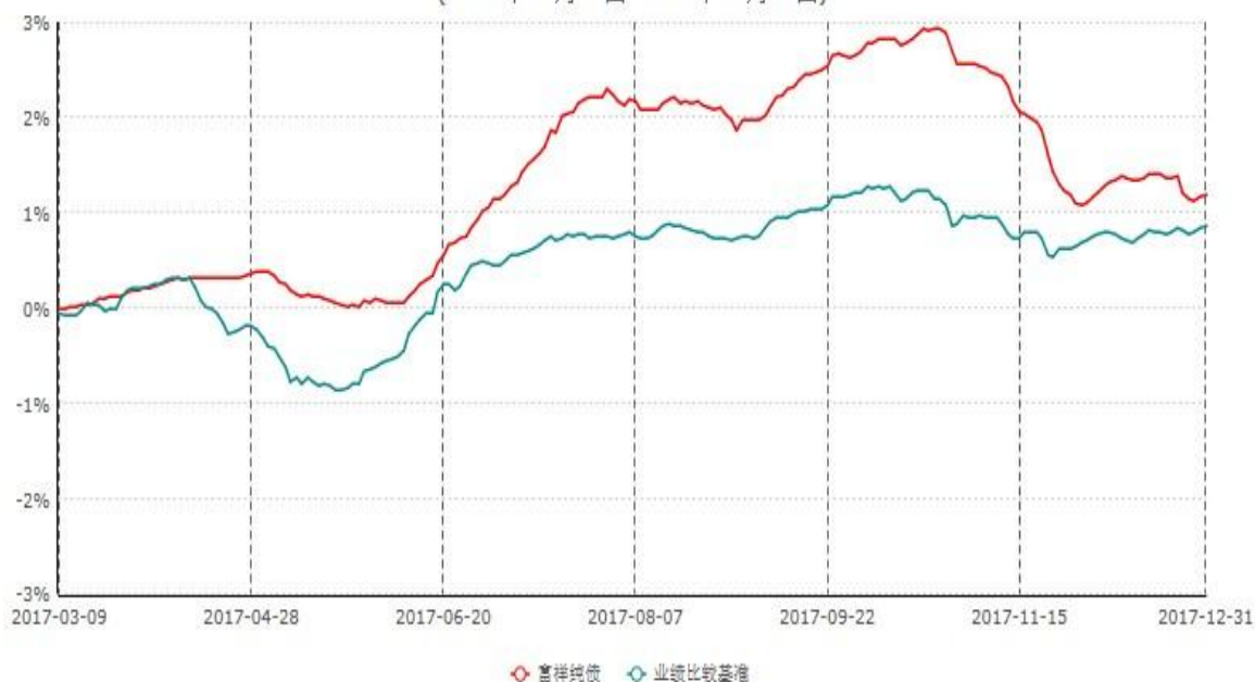
富荣富祥纯债债券型证券投资基金累计净值增长率与业绩比较基准收益率历史走势对比图 (2017年03月09日-2017年12月31日)

注：①本基金基金合同于2017年3月9日生效，截止2017年12月31日止，本基金成立未满一年；